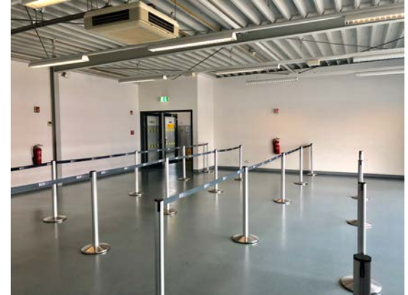
Pier 3a, 1. OG

2004 für Low-Cost-Verkehr errichtet | ca. 4.000 m 2 Grundfläche | zwei Geschosse