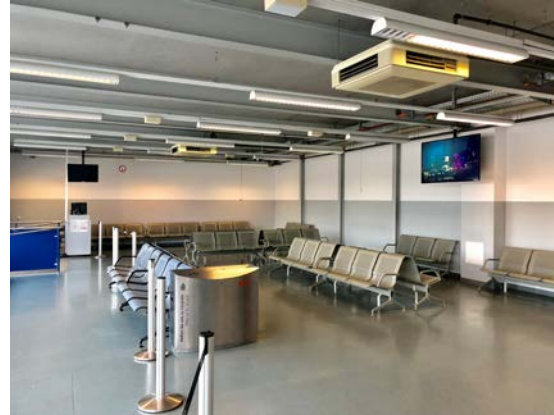
Pier 3a, EG, Gate